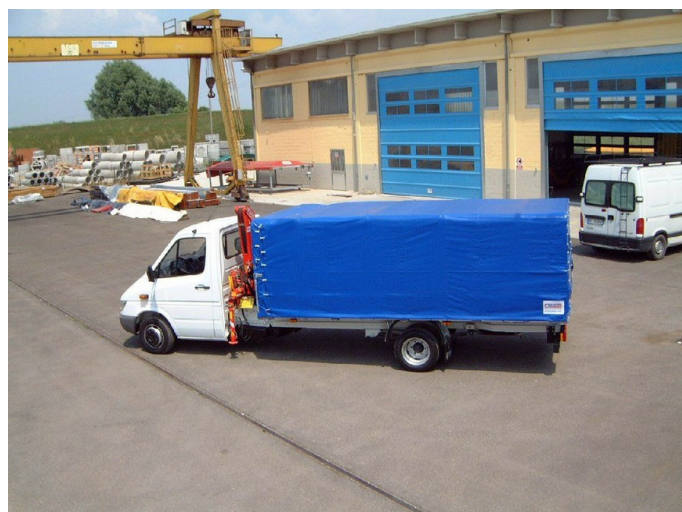
Peitteen avaus tai sulkeminen käy hetkessä.