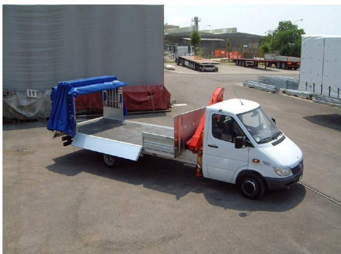
Avolavan ja kuormapeitteen edut samassa ajoneuvossa.

Smart-Tarp liukupeite valmistetaan aina yksilöllisesti lavan mittojen mukaan.